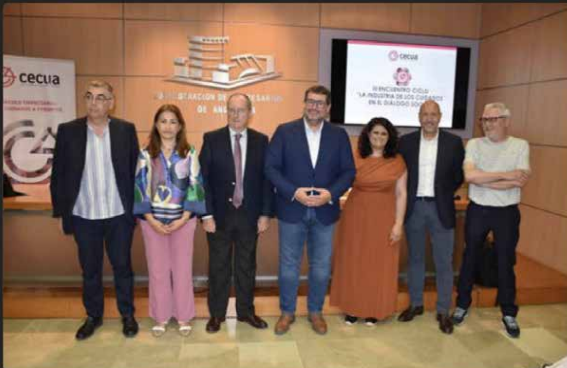
Asamblea general ordinaria del Círculo Empresarial de Cuidados a Personas en Andalucía (Cecua).