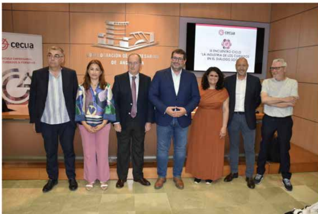
CECUA analiza en su encuentro anual el contexto financiero y normativo del sector de los cuidados, y propone encontrar equilibrio entre sector público, agentes sociales y patronales

La patronal andaluza de los cuidados a personas, destaca que el sector sociosanitario andaluz requiere de la negociación colectiva y del diálogo social a tres partes "las transformaciones sectoriales tienen que llegar con acuerdos del sector público, agentes sociales y patronales".