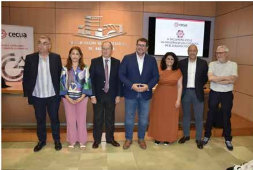
Asamblea general ordinaria del Círculo Empresarial de Cuidados a Personas en Andalucía (Cecua).