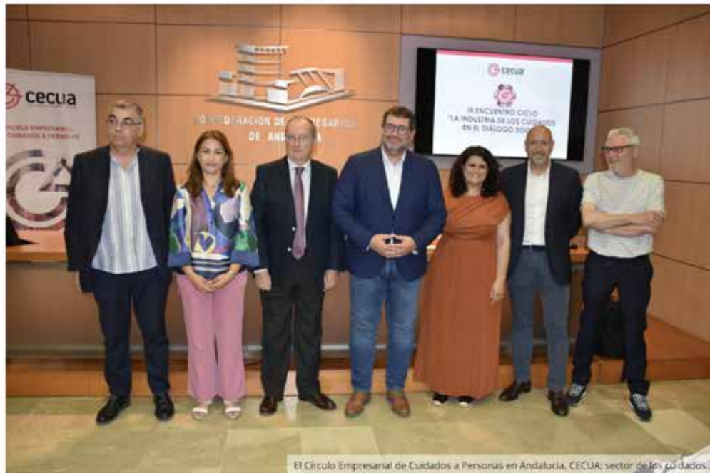
El Círculo Empresarial de Cuidados a Personas en Andalucía, CECUA: sector de los cuidados.